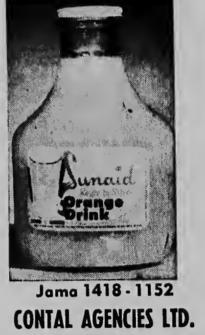
Jama 1418-1152 CONTAL AGENCIES LTD.